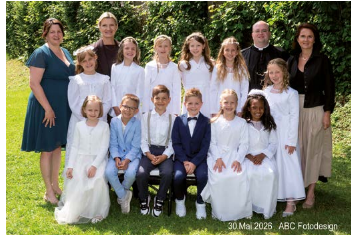
30. Mai 2026

Ein herzliches Dankeschön ergeht an alle Familien unserer Erstkommunionkinder und den Pfarrangehörigen, welche mit viel Engagement und Freude die Kinder in der Vorbereitungszeit und an diesem Tag unterstützt und begleitet haben.