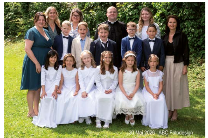
30. Mai 2026 ABC Fotodesign