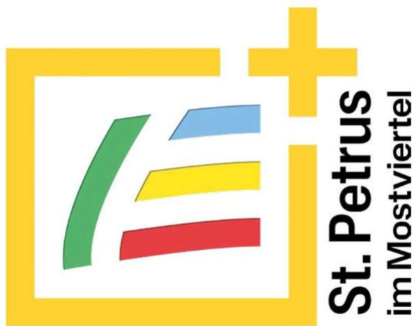
Bildnachweis Logo: PV St. Petrus im Mostviertel

Seit kurzem hat unser Pfarrverband St. Petrus im Mostviertel ein gemeinsames Logo. Eine Grundidee dazu meinerseits wurde im Pfarrverbandsrat bzw. einer kleinen Abordnung weiterentwickelt. Das Ergebnis sehen Sie nun vor sich.